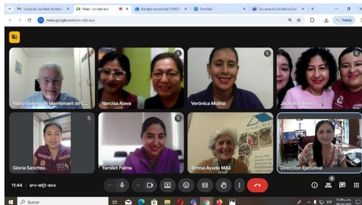
Foto de la sesión del 29 de octubre de 2025

Estas sesiones ofrecieron al equipo UMAVI las herramientas sobre el modo de hacer un análisis con la involucración y colaboración del personal de todas las áreas de UMAVI y FRM. Se confirmó que el autocuidado sigue siendo fundamental para el equipo UMAVI, y que el análisis permanente de casos con todo el equipo debe ser un compromiso de la formación. Asimismo, se constató la necesidad de que el equipo siga formándose hasta que el propio equipo pueda acompañar y ofrecer esta formación.